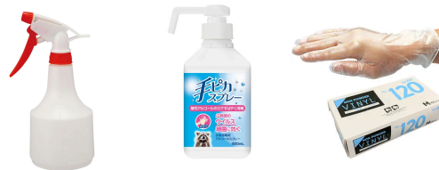
除菌アルコール 手指消毒アルコール 使い捨て手袋

調理機材用のアルコールスプレーと、お客様、スタッフ用の手指消毒アルコールをご用意ください。また、調理者全員が十分に使用できる数量の使い捨て手袋をご用意ください。