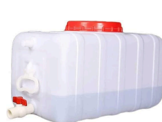
蛇口付きポリタンク

露店は40L以上の浄水タンクと40L以上の排水用タンクが必要になります。(20L×4も可)また手洗い用シンク、ハンドソープ、ペーパータオルをご用意ください。